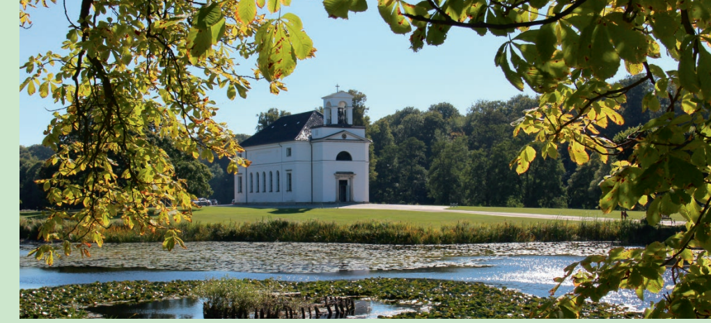
Morten Slotved Borgmester